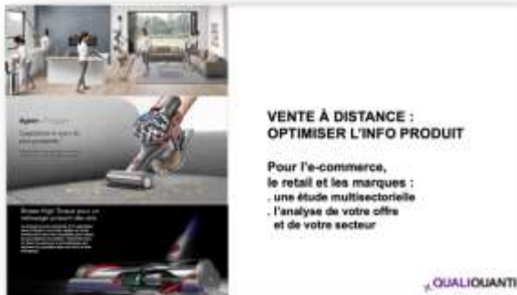
Étude en souscription sur le product content