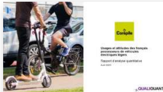
Étude quantitative de type "usages et attitudes"