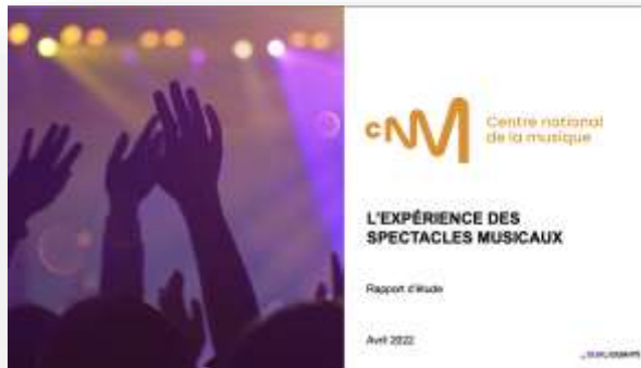
Étude quali combinant une veille, communauté en ligne, entretiens d'experts et sémio-live