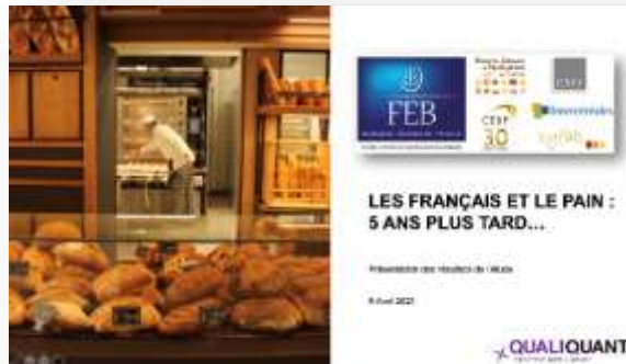
Étude quali & quanti combinant focus groupes, enquête quantitative grand nombre (échantillon représentatif)